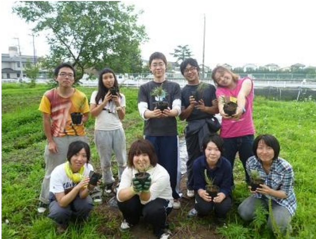
宇都宮大学の皆様 学校の苗畑の一部をお借りして、育てて下さっています。