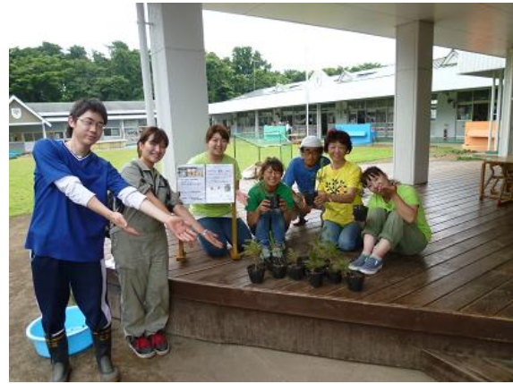
風と緑の幼稚園の皆様 ↑ 子ども達と一緒に育てて下さいます。

まずは、栃木県内のクロマツパートナーの皆さまへ、苗木のお届けを始めました。 皆さま、クロマツの苗木を暖かく迎えて下さっています。 愛情たっぷりに育てられる苗木たちは、きっとすくすく育つことと思います。