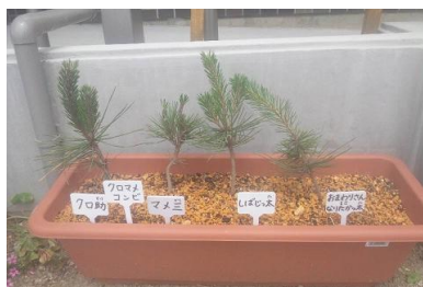
クロスケさん マメゾウさん しばじっ太さん おまわりさんになりたかつ太さん