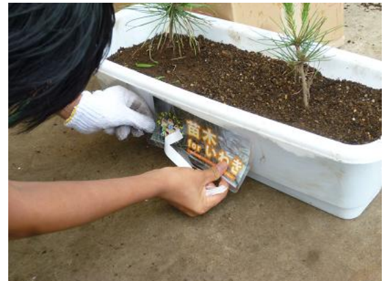
栃木県立益子特別支援学校の皆様。 プランターにラベルも付けて下さいました。