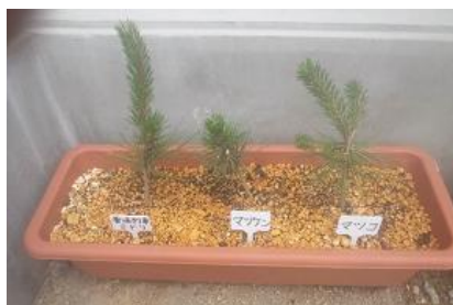
普通列車 ミドリさん マツケンさん マツコさん

エル・ファロ自由空間さん、利用者の皆さまと苗木にステキな名前を付けて下さいました！