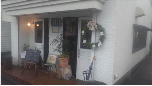
2 tree café

クロマツパートナーでもある、宇都宮市の2 tree caféさんが、苗木 for いわきプロジェクトを応援する寄付メニューの販売を開始してくださいました。2 tree caféさんは、おしゃれでおいしい素敵なカフェです。