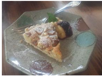
マツノミSweets マツノミタルト